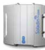
Soladin 2200 WEB