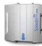
Soladin 3000 WEB